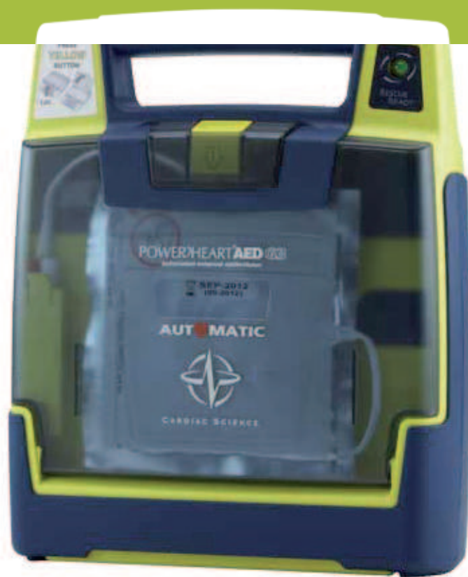
Le Powerheart AED G3 Plus Automatic